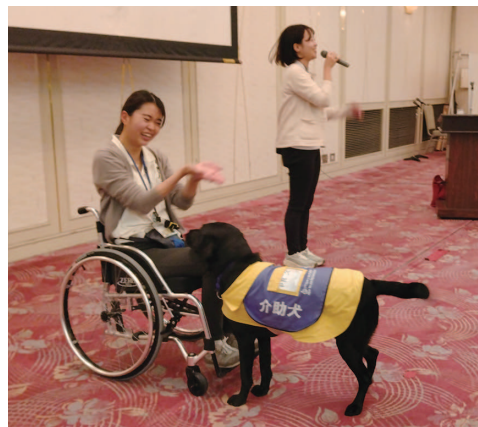
介助犬は障害のある人の日常生活動作をサポート

店も、補助犬をよ く知って、お客様 への対応を心掛け ていかなければと思 いました。一方で、 ペット犬を補助犬 と言い張って入店 しようとする「なり すまし」がいるそう で、対応の難しさを 感じました。 報告 塚田