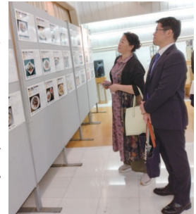
コンテスト参加作品の 展示会場