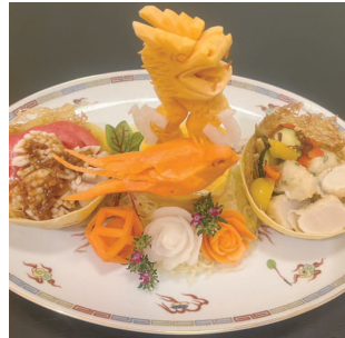
そうめんかぼちゃの ホタテ貝柱二種

今年度より、コンテストは共通のテーマで競う形式になりました。 今回のテーマは「ホタテ」。 愛知組合からは2名の方が参加、受賞しました。 銀賞受賞！麵飯の部 昭と支部 浜木綿 藤垣 登