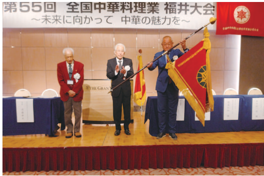
来年は埼玉県大会