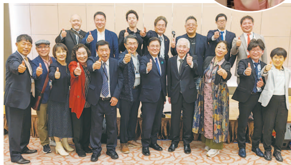
愛知県組合からは16名が大会に参加