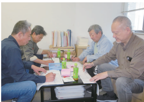
4月17日(水)に開催された物資委員会

町中華の定番、チャーハン・ラーメンのセットは、愛知では「チャーラー」と呼ばれ親しまれていますが、この名称は県外ではあまり知られていません。コロナも収束し、愛知への訪問客が増えてきた今、より多くのお客様に愛知の美味しい「チャーラー」を味わい、名称を知っていただき、新たな愛知名物として発展させていきたいと思います。