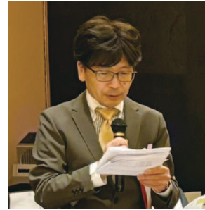
近藤組織魅力づくり委員長

門業者を講師に迎えて、もう一品や期間限定、本日のおすめ品など、簡単にメニューを増やせるアイテムを研修した。